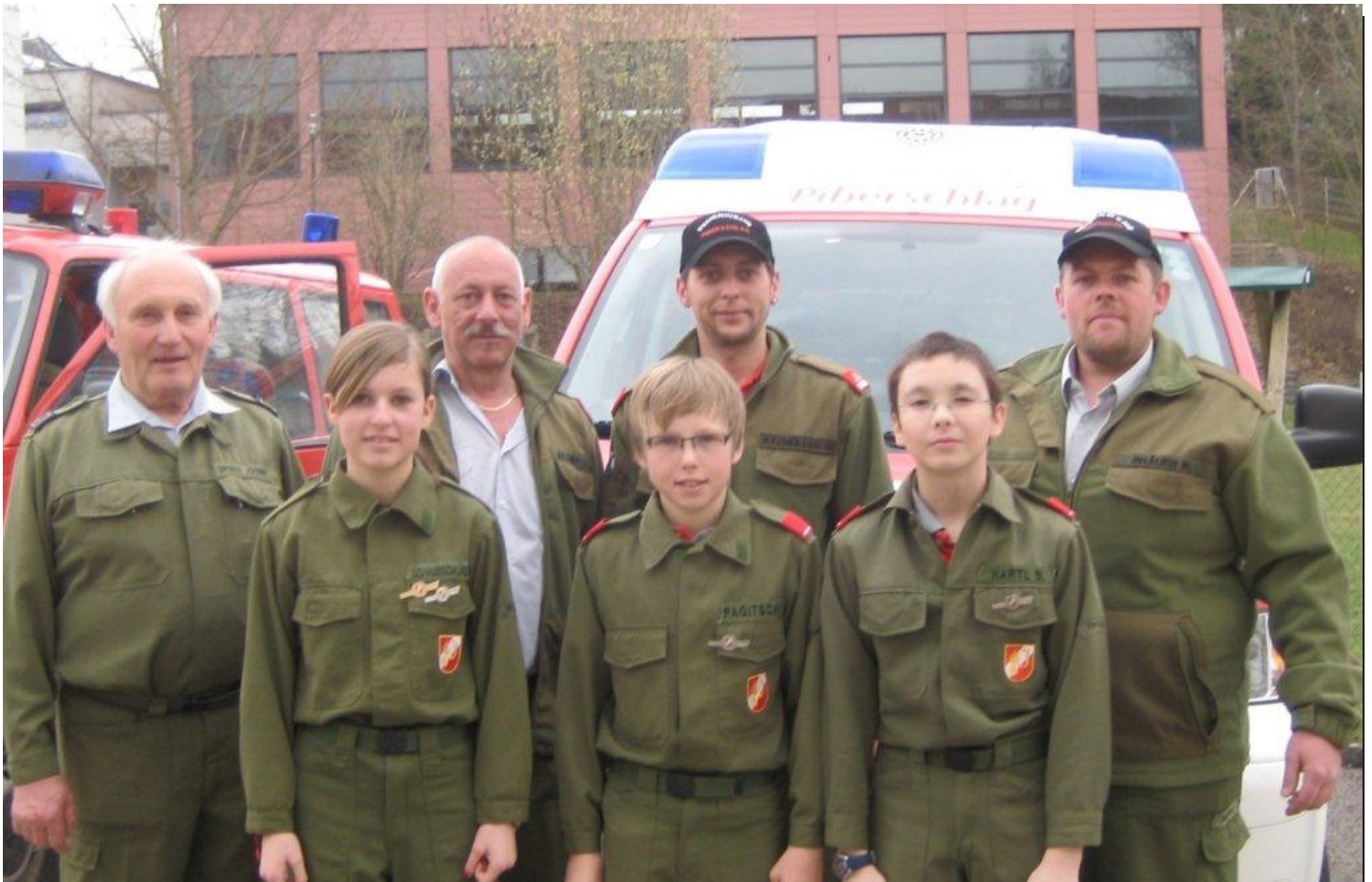
Unsere erfolgreichen Teilnehmer beim Wissenstest mit den Betreuern