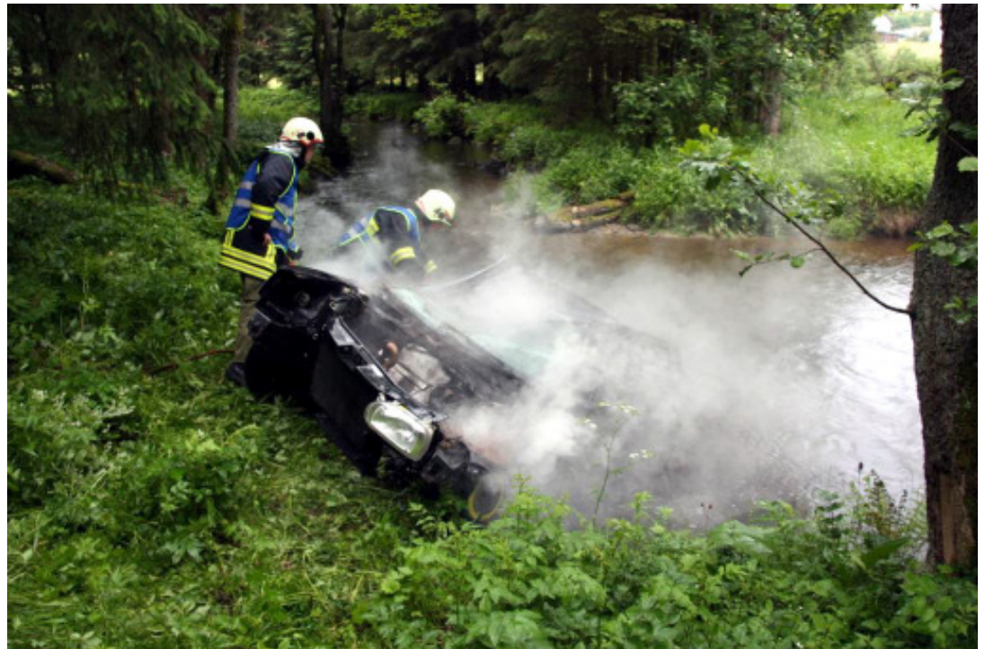
Oben: PKW stürzt in Steinerne Mühl (Rettung des Lenkers erforderlich)

Es findet jeden Monat mindestens eine Übung oder Schulung statt. Dazu kommen noch verschiedene Spezialübungen wie Atemschutz oder Funk.