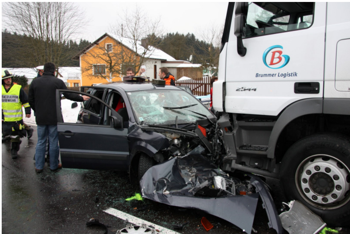
3 Schwerverletzte forderte dieser Verkehrsunfall auf der Böhmerwald Bundesstraße mit einem PKW und 2 LKW.

mit einem schweren LKW der deutschen Bundeswehr zusammen und wurde von diesem wieder zum ersten LKW zurückgestoßen. Dabei wurden 3 Personen schwer verletzt. Wer die Unfallstelle gesehen hat, kann sich ausmalen was alles hätte passieren können. Wir wurden auch zu einer PKW-Berung aus der Steinernen Mühl und zu LKW-Bergungen gerufen.