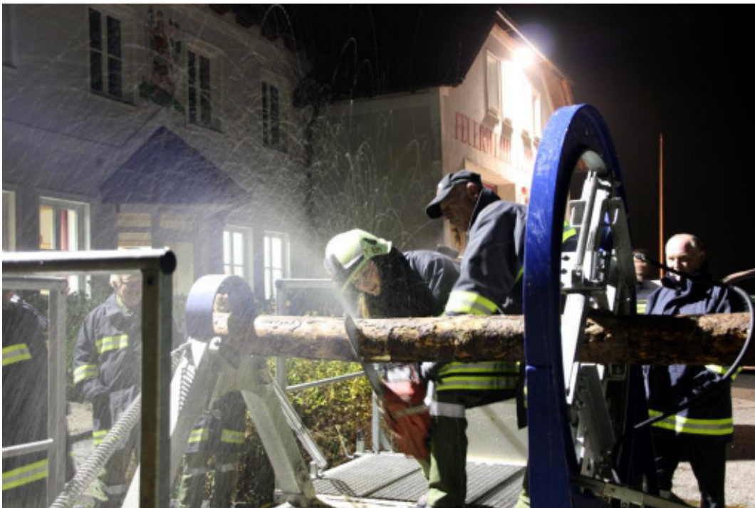
Unten: Unsere Mitglieder lernen den sicheren Umgang mit einer Motorsäge beim Verspannungssimulator