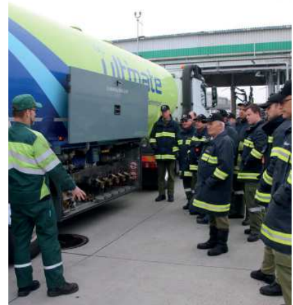
Monatsübung Tankwagenunfall - was tun?