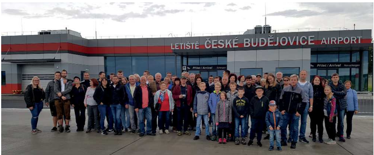
Freiwillige Feuerwehr Piberschlag