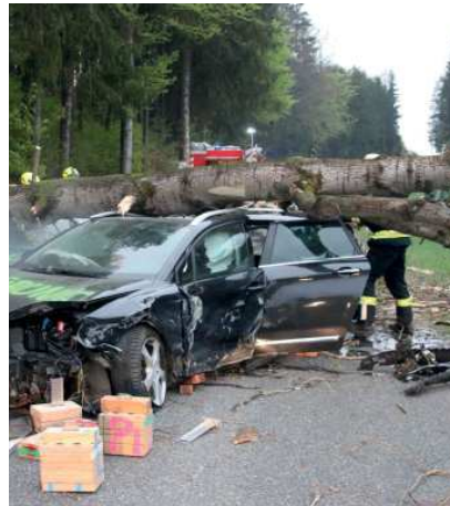
THL Pflichtbereichsübung Schönegg